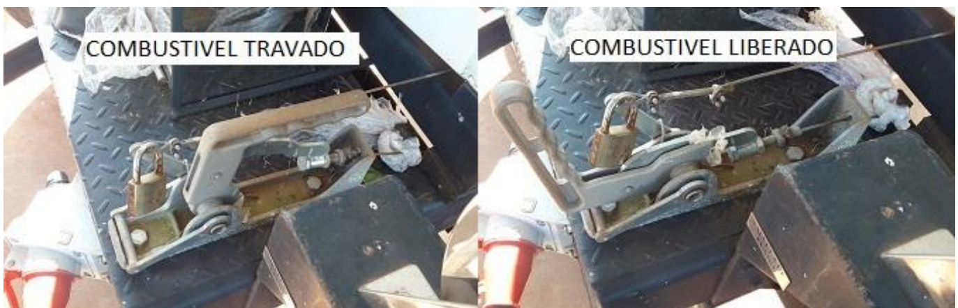
Trava do combustível