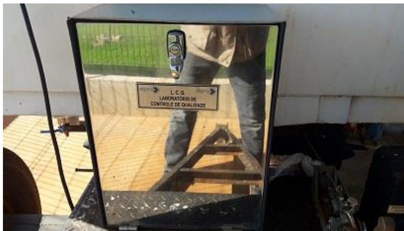
Caixa da prancheta